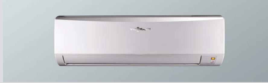
Vitoclimate 300-S Duvar tipi multi iç ünite

Viessmann Merkez/ Istanbul-Anadolu Tel: 0216 528 46 00 Faks: 0216 528 46 50 Viessmann Istanbul-Avrupa Tel: 0212 414 89 79 Faks: 0212 481 57 15 Viessmann Ankara Tel: 0312 205 19 20 Faks: 0312 232 45 02 Viessmann Bursa Tel: 0224 248 00 99 Faks: 0224 245 73 35 Viessmann Izmir Tel: 0232 492 09 09 Faks: 0232 472 13 47 Viessmann Kayseri Tel: 0352 223 18 14 Faks: 0352 223 18 16 Viessmann Antalya Tel: 0242 311 83 93 Faks: 0242 311 83 23 Viessmann Konya Tel: 0332 324 77 43 Faks: 0332 324 77 45 Viessmann Adana Tel: 0322 230 00 95 Faks: 0322 234 22 00 Viessmann Samsun Tel: 0362 315 06 01 Faks: 0362 438 88 61 Internet: www.viessmann.com.tr E-Mail: info-klima@viessmann.com.tr