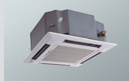
Vitoclimate 300-S Kaset tipi multi iç ünite